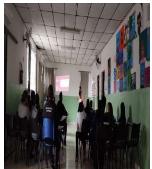
REUNIÃO SOCIOEDUCATIVA OUTUBRO ROSA