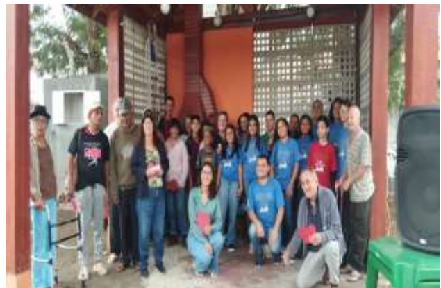
APRES. DOS USUARIOS NA CASA DE LONGA PERMANENCIA – VIDA LONGA 10/10/2025