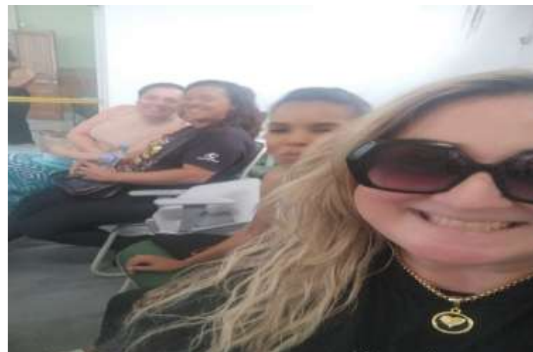
REUNIÃO CMDCA 02/10/25