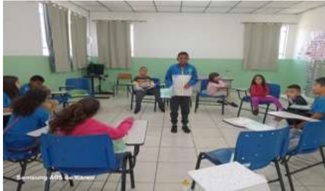
Oficina psicossocial: cartaz para o futuro 20/10/25