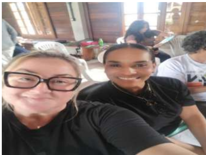
CAPACITAÇÃO ILA 29/10/25