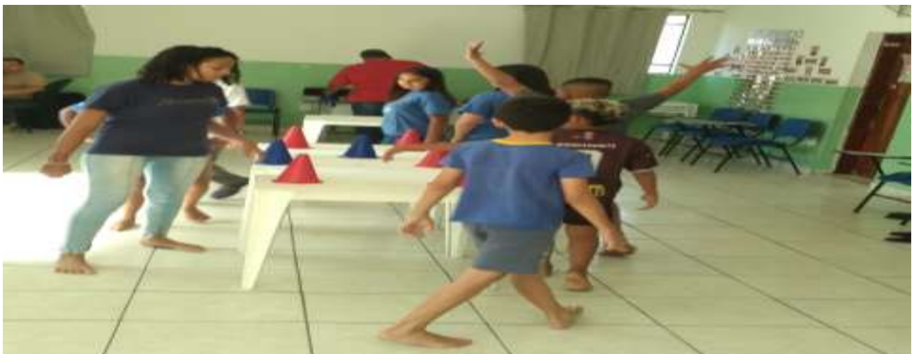
OFICINA DE LAZER E JOGOS - DANÇA DOS CONES 18/10/25