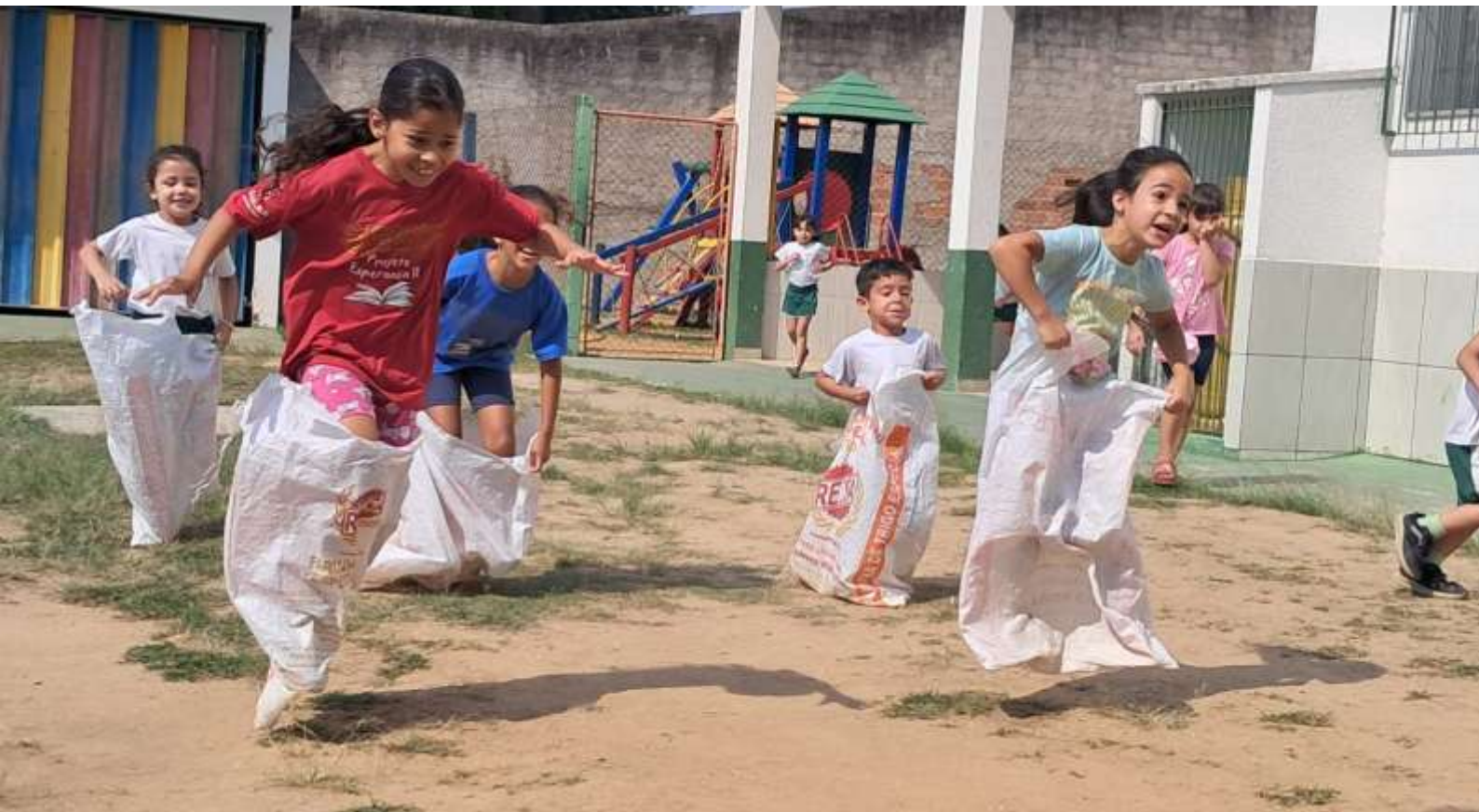
Oficina lazer: corrida do saco 10/10/25