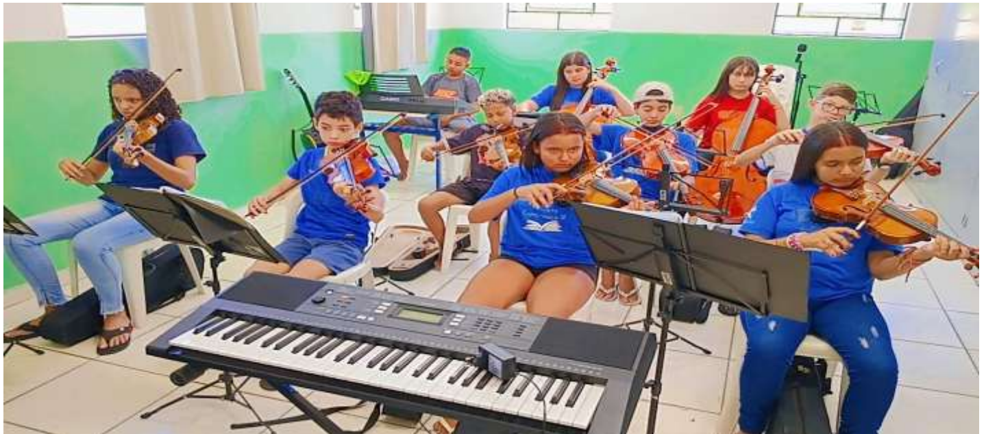
Ensaio para a cantata de Natal 23/10/25