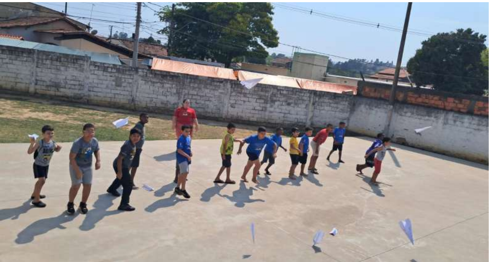
Oficina artes: competição de aviões de papel 15/10/25