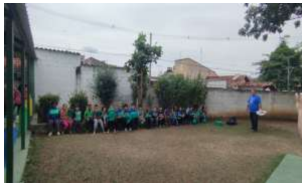
ENTREGA DAS LEMBRANÇAS DAS CRIANÇAS 10/10/25