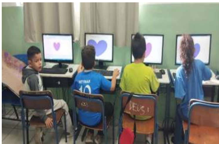
Ofic. Informática trabalhou o tema com ludicidade com as crianças (Agosto Lilás)12/08/25