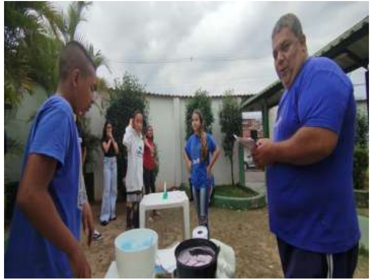
Ofic.lazer e jogos/torta na cara com quis Agosto Lilás 22/08/25