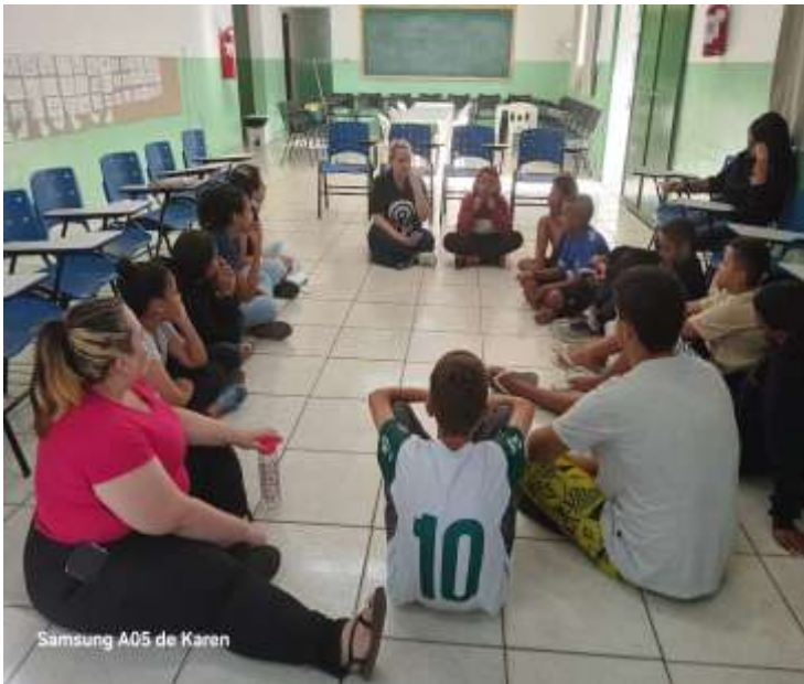
Ofic. Psicossocial 20/08/25 debate sobre Agosto Lilás