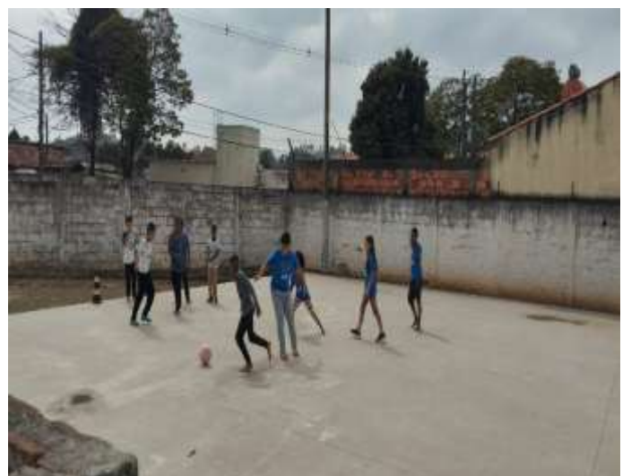
Ofic. Esporte futebol 14/08/25