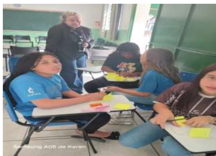
Ofic. Psicossocial caixa das emoções 04/08/25