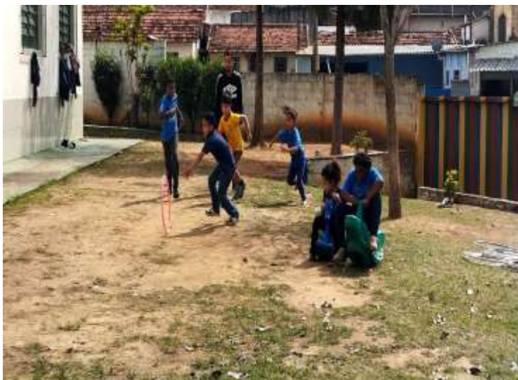
Ofic. Esporte circuito do respeito/utilizando bambolê 21/08/25