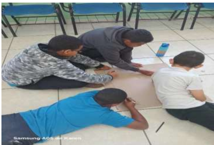
Ofic. Artes confecção árvore da família 18/08/25