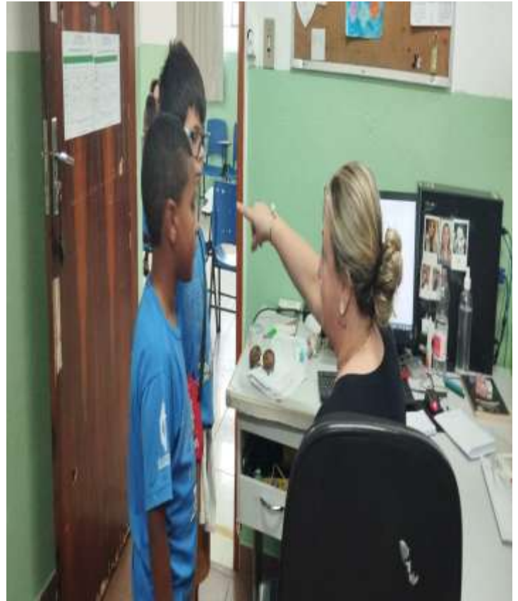
Mediação de conflitos 29/08/25