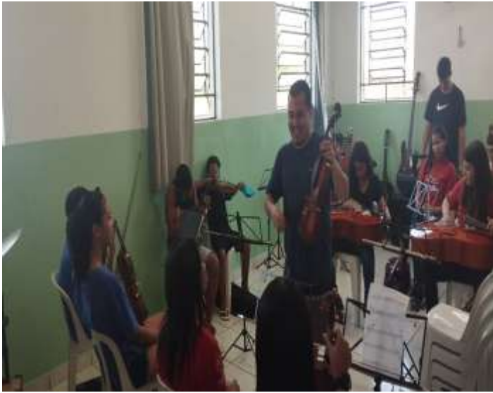
Ofic. Musica manutenção instrumentos 14