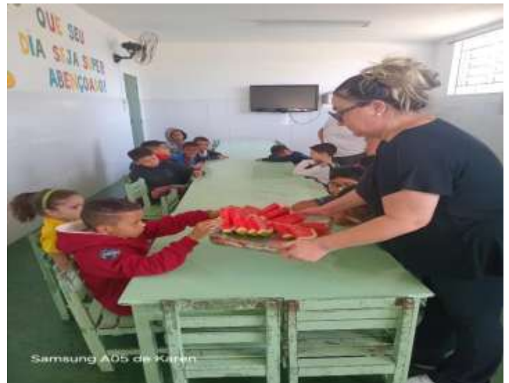
Lanche diário 25/08/25