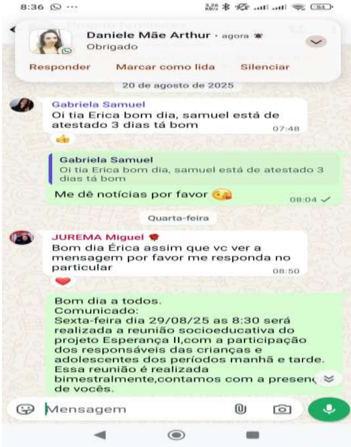
20/08/25 contato diário/whatsapp