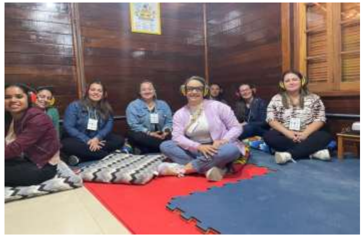
Vivencia no Universo Sensorial-ILA