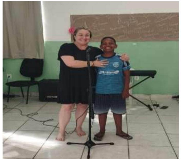
Ofic. Música poesia cantada 07/08/25