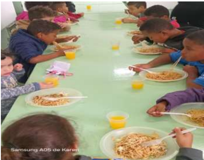
Lanche diário-dia do macarrão com queijo 19/08/25

Redução e mediação de conflitos com a realização das escutas qualificadas e intervenções possibilitaram resolver situações de agressividade verbal e física, promovendo o diálogo e a conscientização sobre respeito mútuo.