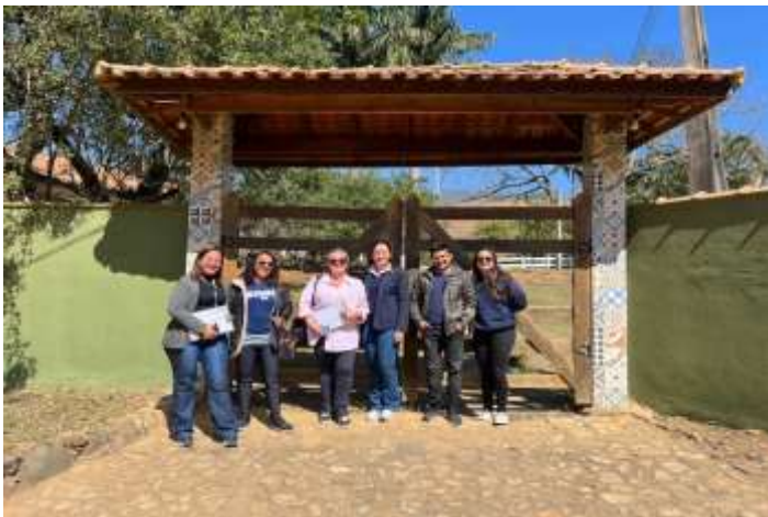
Visita do CMAS Casa Dom Bosco