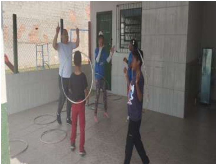
04/07/25 ofic.musica dança c/bambolês