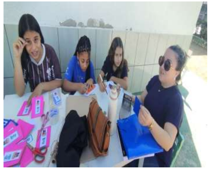
Atividades para o dia dos avós 09/07/25