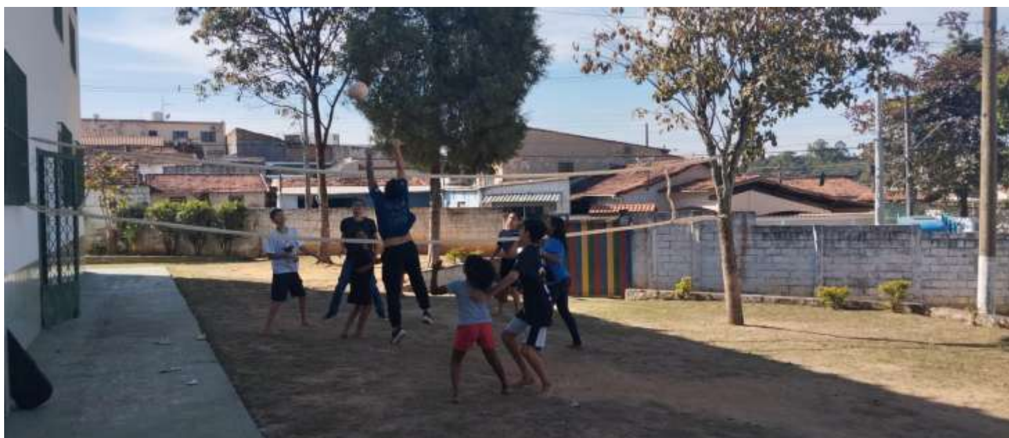
Brincadeiras livres 29/07/25 volei