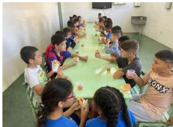
Lanche diário 21/07/25