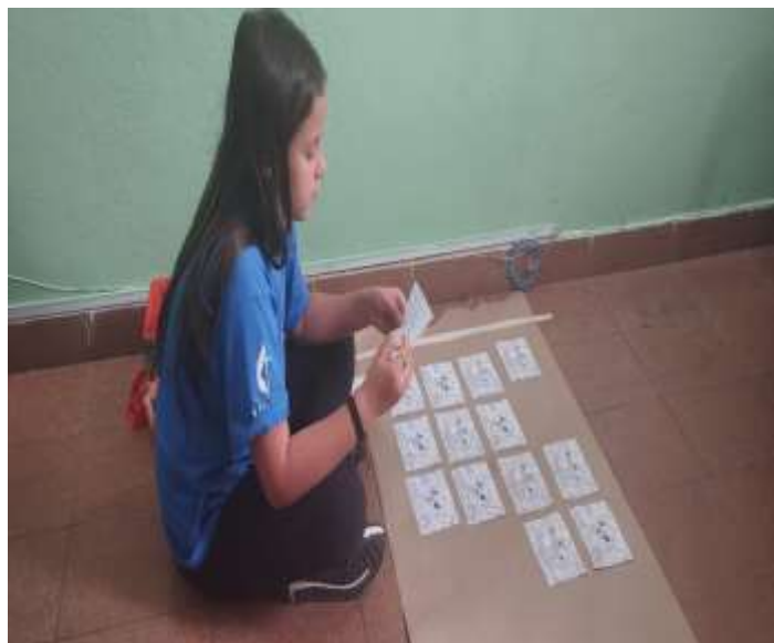
14/07/25 montagem de painel Boob Goods