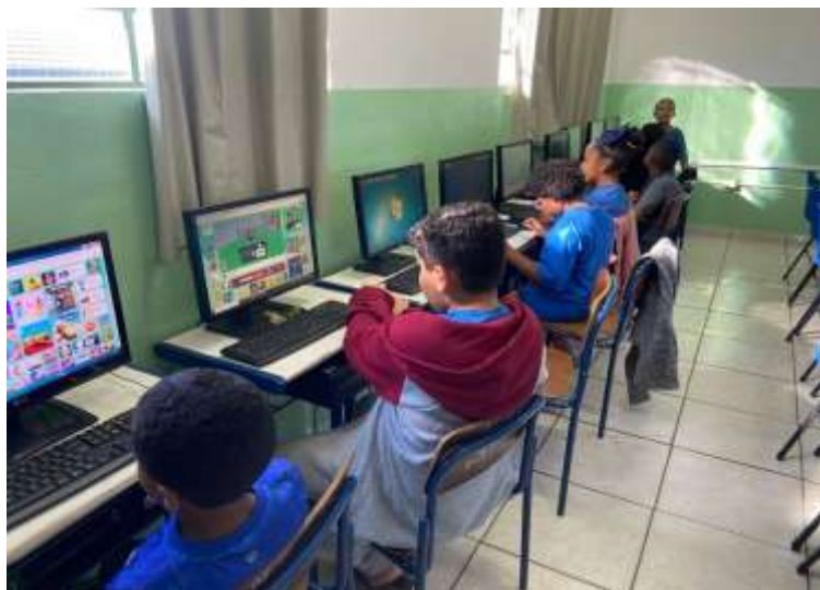
15/07/25 ofic.informatica / jogos lúdicos