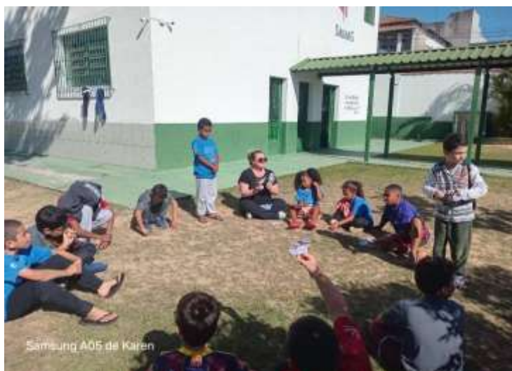
Acolhimento diário 08/07/25

Integração e socialização com a comunidade, fortalecendo os vínculos afetivos entre amigos, proporcionou um ambiente acolhedor e aconchegante.