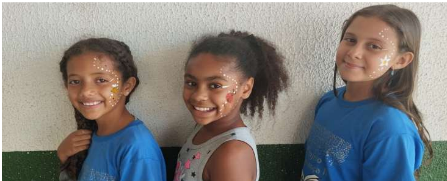
Pintura facial 30/07/25 Ofic. artes