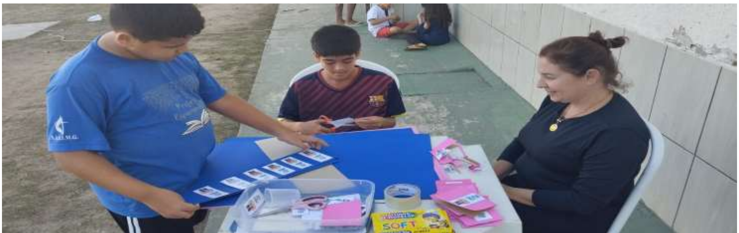
Continuação das atividades para o dia dos avós 11/07/25