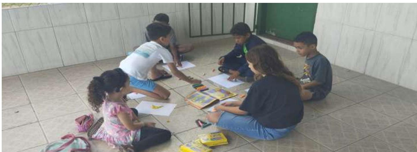
Brincadeiras livres com massinha de modelar 23/07/25