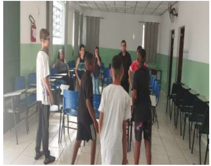
22/07/25 ofic. Psicossocial