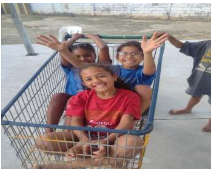
25/07/25 ofic. lazer