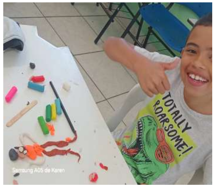
30/07/25 ofic.artes massinha modelar