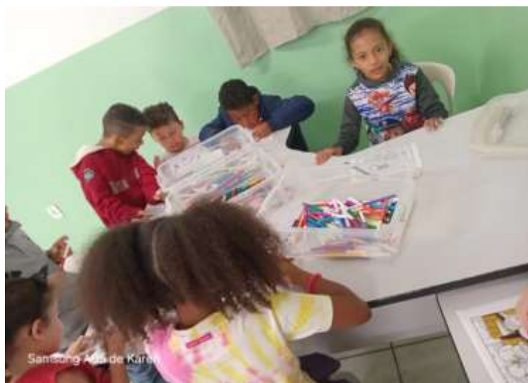
11/07/25 ofic. Psicossocial “o que fiz nas férias”?