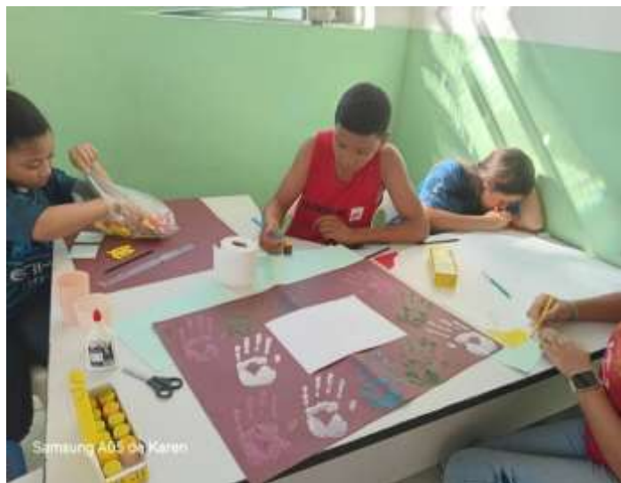
7/7/25 ofic. artes cartazes temáticos