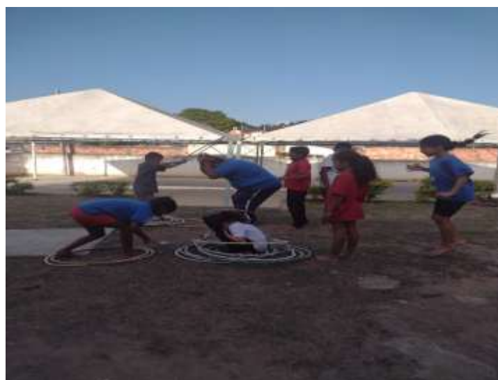
16/07/25 lazer circuito