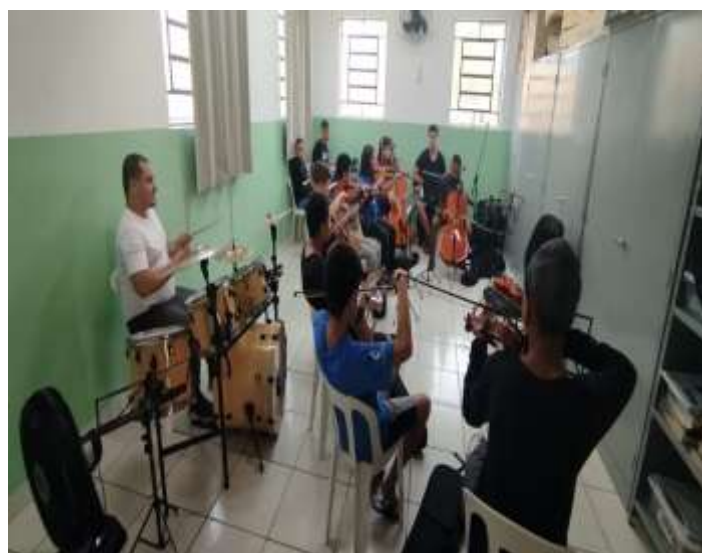
25/07/25 ofic.musica orquestra