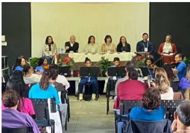
15 Conferencia Municipal de Assistência Social 01/07/25/participação orquestra de cordas.