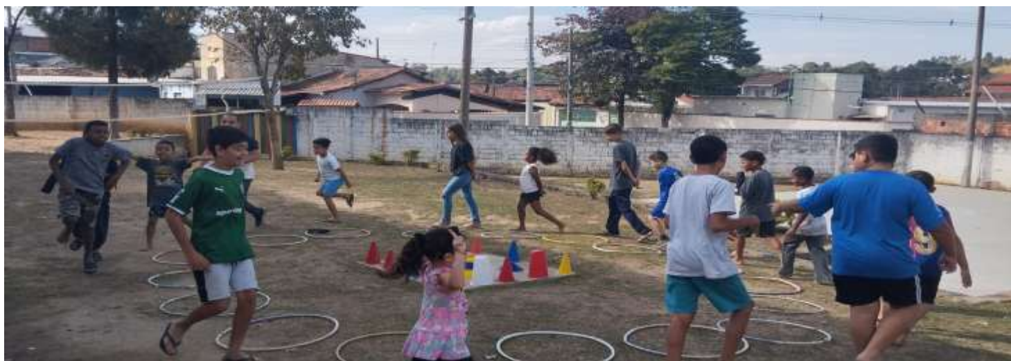
Ofic. Lazer 15/07/25 circuito