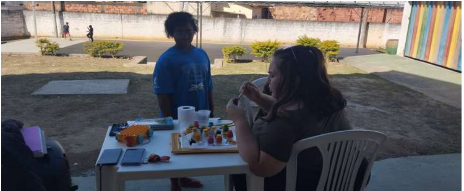
Pintura facial 18/07/25