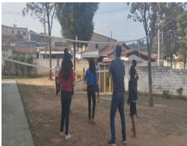
23/07/25 ofic. Lazer volei