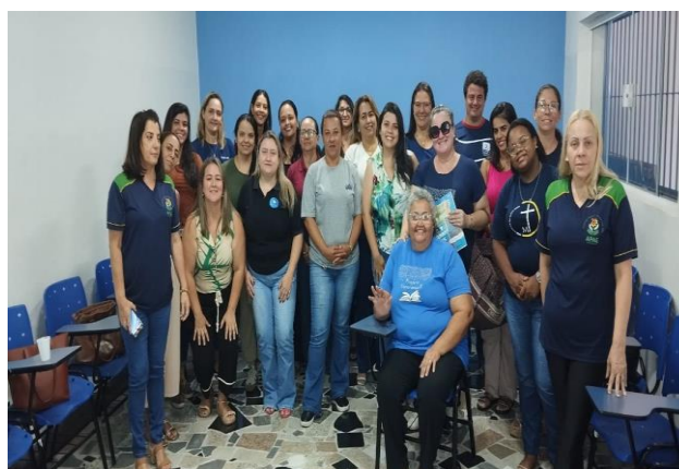
Reunião Gestão de Parcerias 26/11/24