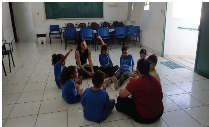
Oficina Psicossocial/07/11/24 roda de conversa sobre autocuidados pessoais