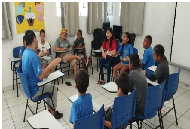
Oficina música/trabalhando letras de músicas 13/11/24