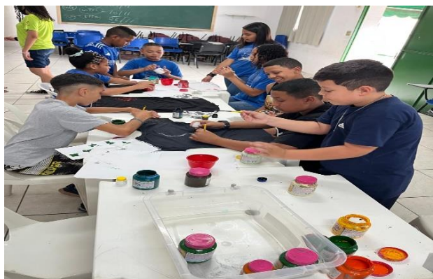
Oficina Artes/camiseta customizada 18/11/24

Melhorou significamente o comportamento agressivo e hostil com os demais usuários e fortalecer o grupo e destacou o protagonismo dos usuários.