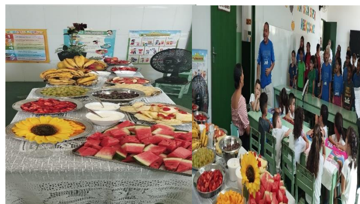
AÇÃO DE GRAÇAS 28/11/24