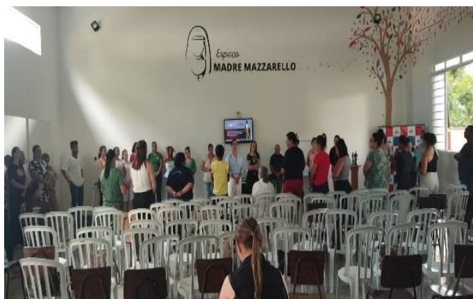
As Conquistas e os Desafios na Articulação com a Rede de Proteção