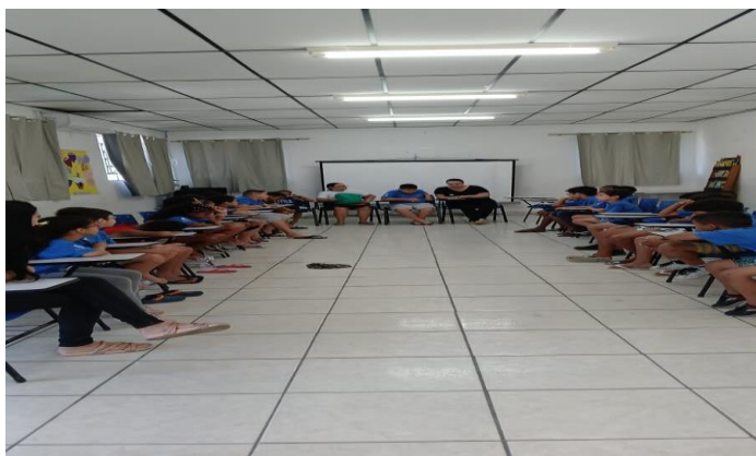
ACOLHIMENTO DIÁRIO 05/11/24

Impactou diretamente no comportamento dos usuários, houve uma redução nas situações de conflitos e uma melhora crescente no comportamento direto dos usuários e seus familiares.