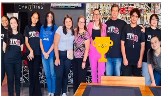
VISITA AO HOTEL IBIS 27/11/24