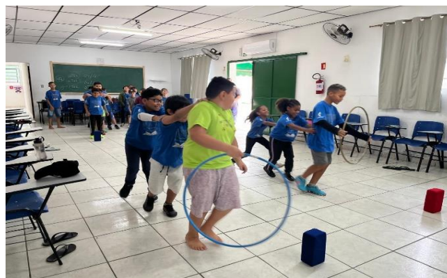
Oficina lazer/dinâmica de socialização em grupo 27/11/24