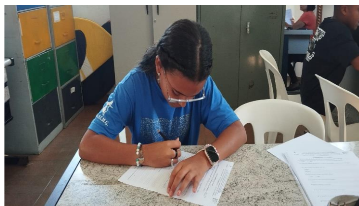
APLICAÇÃO DE QUESTIONÁRIO DE SATISFAÇÃO 19/21/24/25/26/27