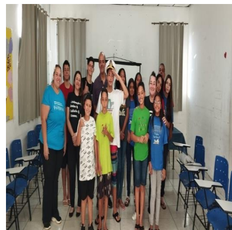
Palestra FORÇAS ARMADAS /Marinha 26/07/24