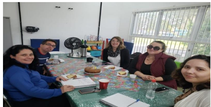
Articulação CRAS 19/07/24