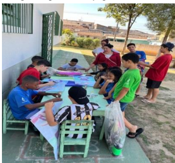
Lazer e jogos/pipa 10/07/24