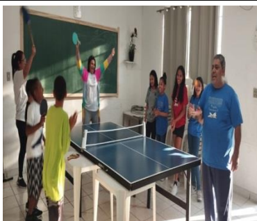
Ping-Pong /lazer e jogos 10/07/24

Aumento da conscientização e da importância da prevenção; Desenvolvimento da socialização e das emoções dos usuários; Fortalecimento dos laços familiares; Valorização da cultura e tradições; Desenvolvimento de habilidades.