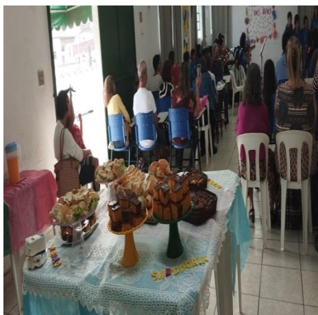
Dia dos avós 26/07/24