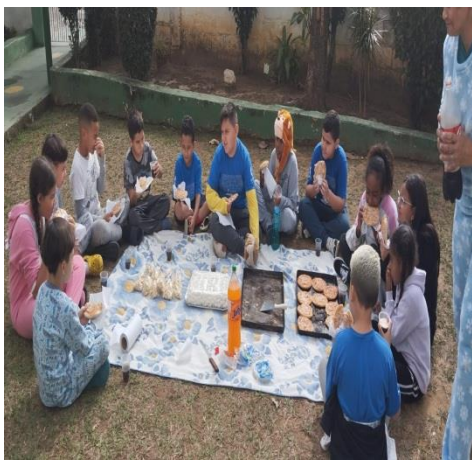
Aniversariante e festa do pijama 03/07/24