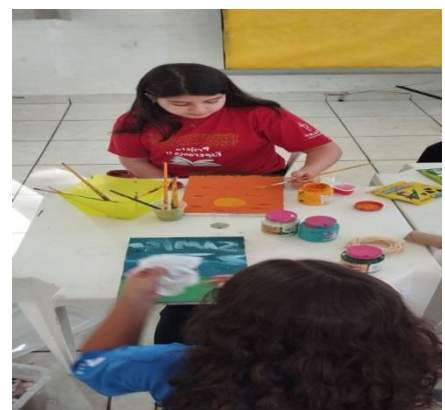
Pintura em tela 12/07/24