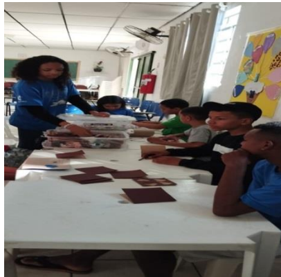
Of. Artes/ cartões de dia dos avós 22/07/24