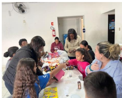
Psicossocial/integração com os familiares