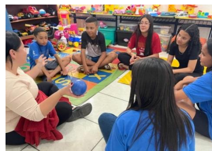
Psicossocial/roda de conversa 25/07/24