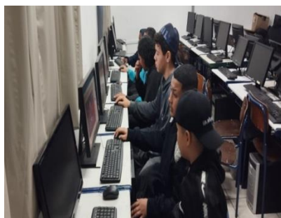
Ofic. Inf./ direitos e deveres 23/07/24