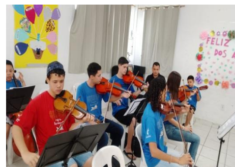
Ensaio da orquestra, dia avós 12/07/24