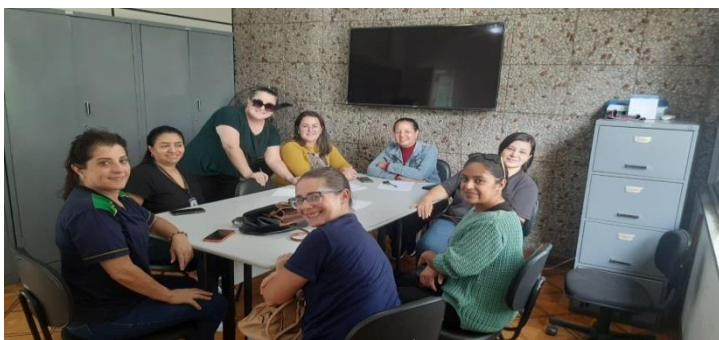
Reunião CMDCA Conselheiros 11/07/24