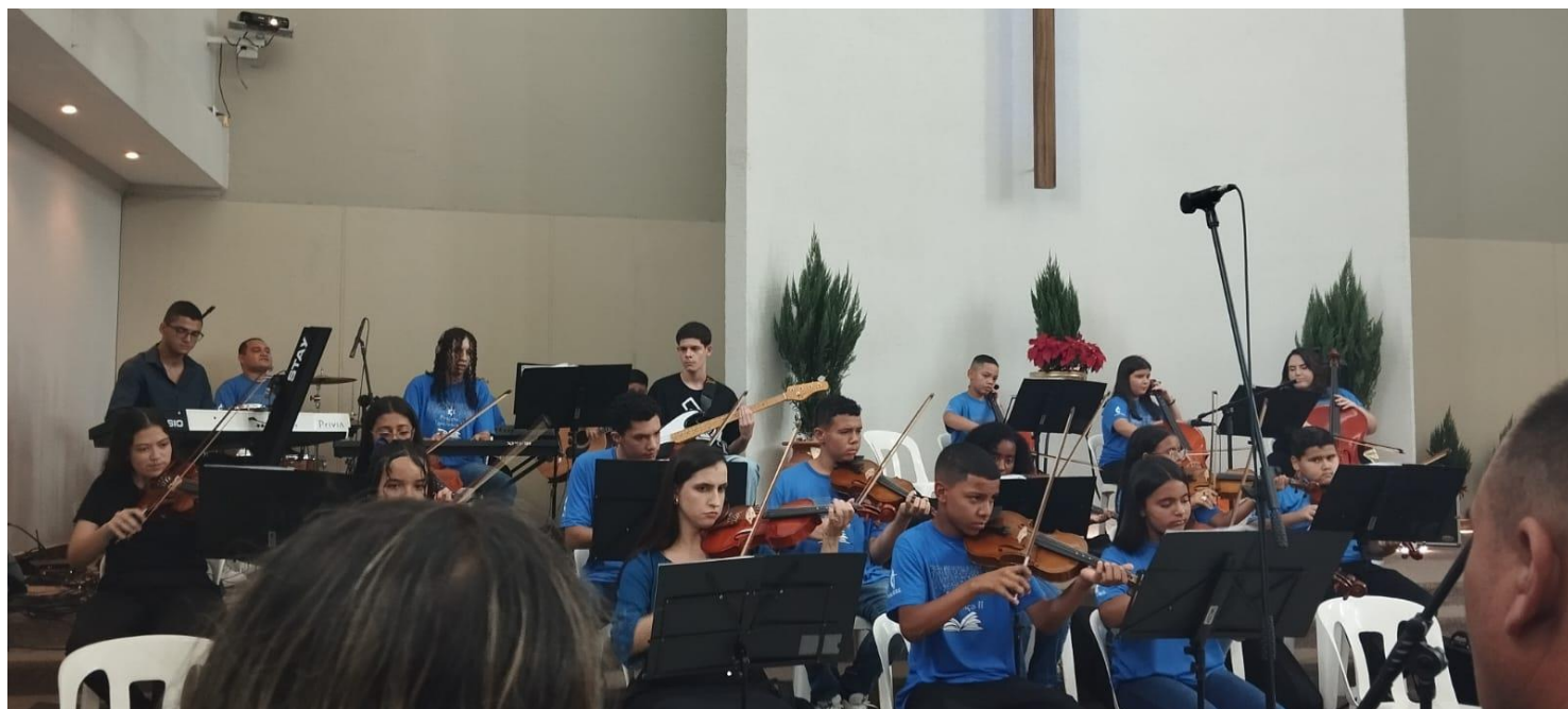
Ofic. Musica 08/12/24 – Apresentação da orquestra de cordas e do coral na Cantata de Nata