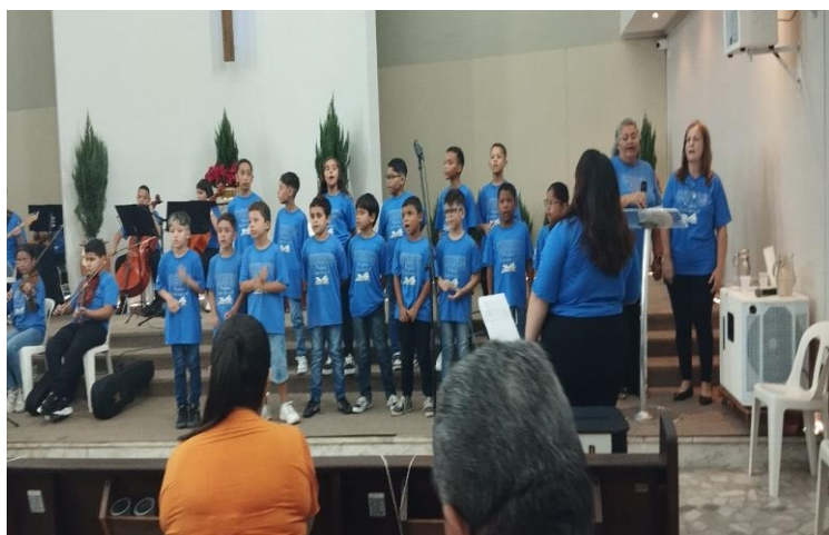
APRESENTAÇÃO CANTATA DE NATAL 08/12/24

- A participação na apresentação da orquestra e do coral impactou diretamente a vida dos usuários, incentivou a se descobrirem como músicos e valorizarem suas habilidades, por menor que seja, reforçando a autoconfiança, autonomia, o senso de equipe e valorização.