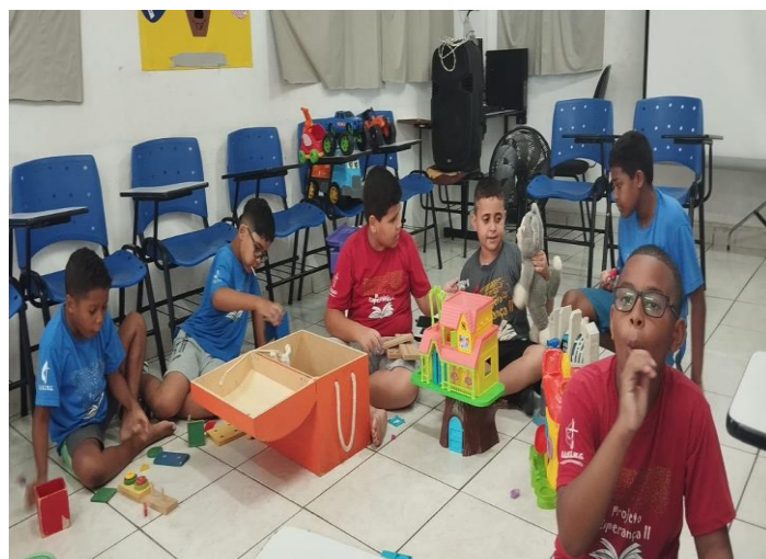
Ofic. Lazer e jogos 11/12/24