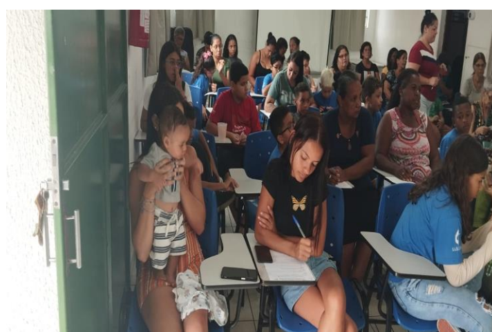
APLICAÇÃO QUESTIONÁRIO DE SATISFAÇÃO 05/12/24 PAIS E/OU FAMILIARES