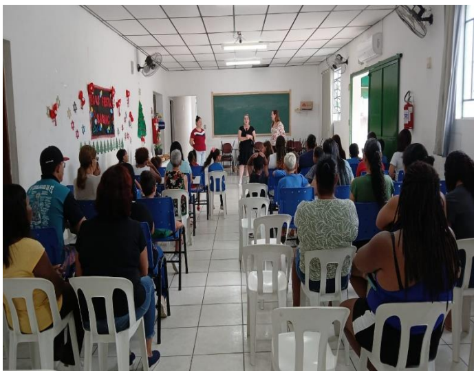
REUNIÃO SOCIOEDUCATIVA 05/12/24