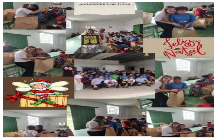
APADRINHAMENTO USUÁRIOS 14/12/24