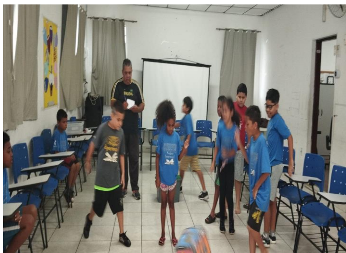
Dinâmica psicossocial 04/12/24 Caminho dos Direitos e Deveres