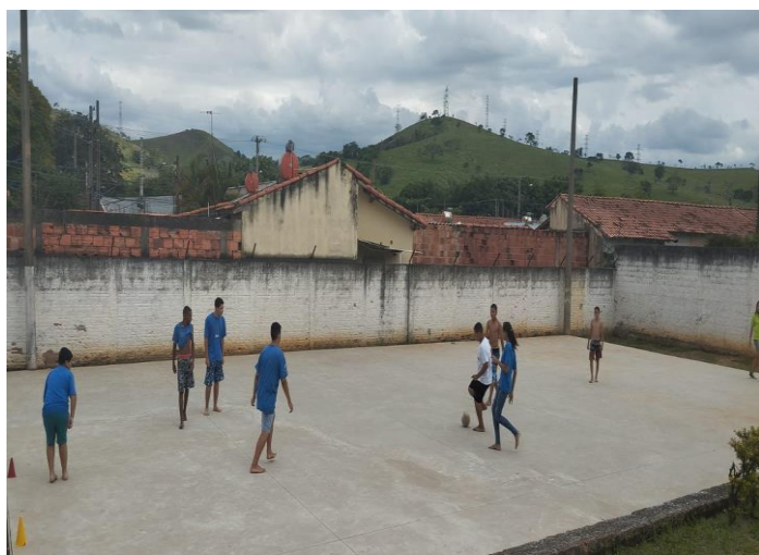
Ofic. Esporte/futebol 17/12/24