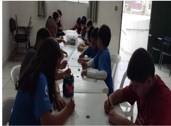
Ofic. Artes 09/12/24 Desenhos e cartinhas para o papai Noel