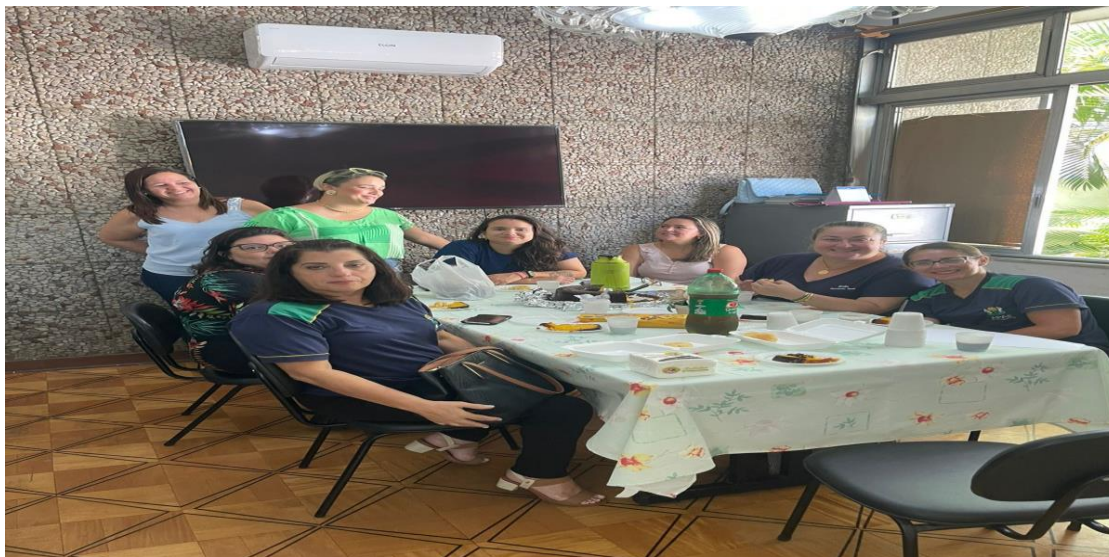
REUNIÃO CMAS 18/12/24

- Fortaleceu as parcerias de rede de apoio, atualizou os profissionais de acordo com a sua demanda, melhorou a qualidade de comunicação com a rede, contribuiu para a defesa de direitos e ao combate das violações, buscando medidas efetivas para a proteção dos usuários.