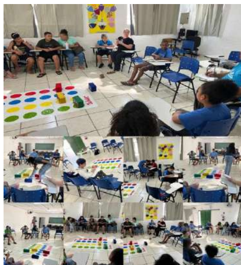
Quis de perguntas e respostas/ Psicossocial 19/08/2024