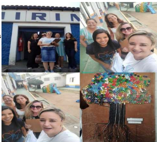
Visita técnica do CMAS nas OSCs