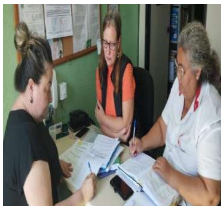
Reunião com a coordenação 12/08/2024