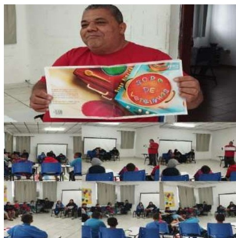
Atividade de arte/Sopa de letrinhas 18/08/2024