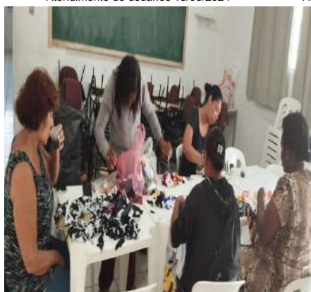
Grupo de familiares/confec. Tapetes 22/08/24