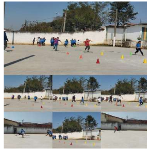
Atletismo / esportes 27/08/2024