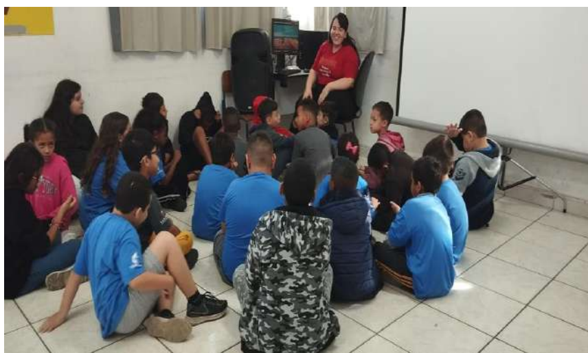
Atividade dinâmica musical/ complete a música 05/08/2024