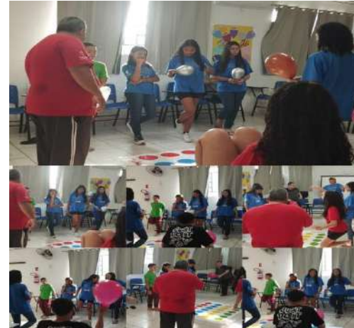
Atividade de lazer/ dinâmica bexiga 07/08/2024