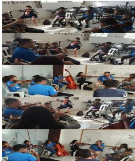
Ensaio do coral/música 30/08/2024