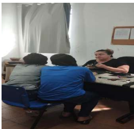
Atendimento de usuários 13/08/2024