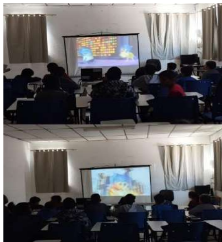
Filme Divertidamente 1 e 2 Psicossocial 26/08/2024