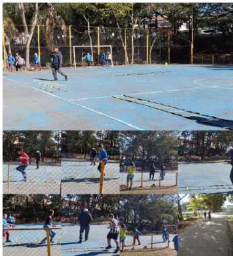
Atletismo/esportes 06/08/2024 Parque ecológico