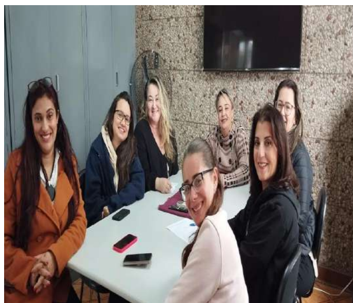
Reunião ordinária CMAS