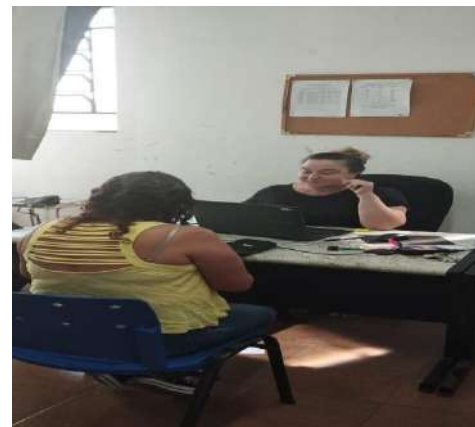
Atendimento familiar 13/08/2024