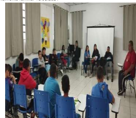
Acolhimento diário 20/08/2024