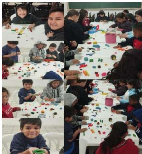
Atividades com massinha modelar oficina artes 25/08/2024