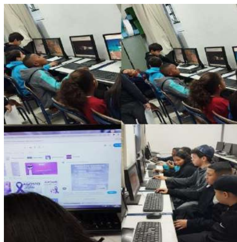
Informática Agosto Lilás e jogos infantis 12/08/2024