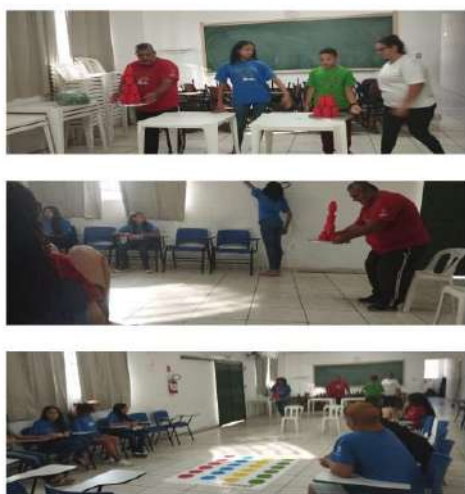
Dinâmica das garrafas vermelhas Lazer e jogos 21/08/2024