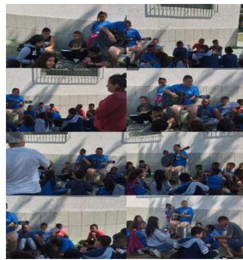
Roda de conversa musical 08/08/2024