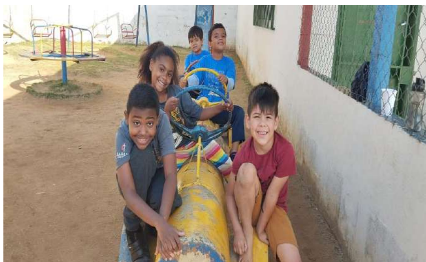
Dia de parquinho/lazer 30/08/2024