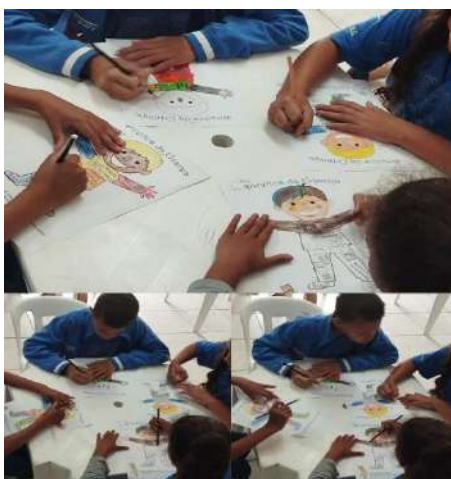
Atividades impressas/artes e psicossocial Direitos e deveres 15/08/2024