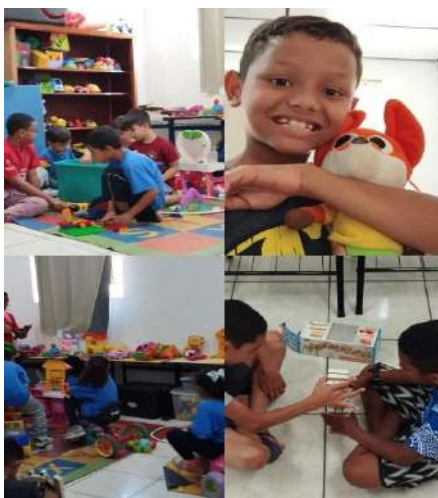
Brinquedoteca /lazer 09/08/2024