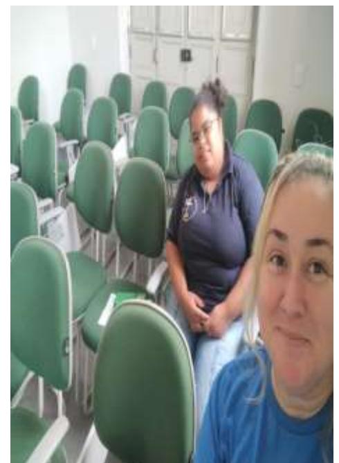
CMDCA no dia 08/03/24