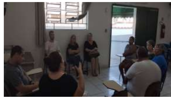
Fig 02- Reunião equipe 15/03/24