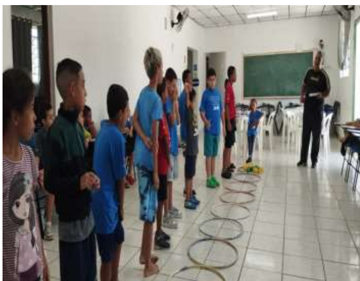
Lazer e jogos/ativ. Bambolê 27/03/24