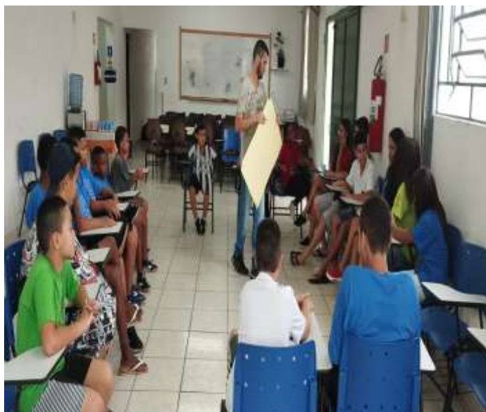
At. psicossocial/autógrafos 19/03/24