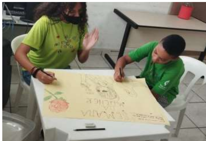
Cartaz temático/mês das mulheres 07/03/24