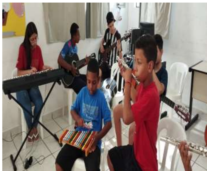
Ensaio de música/Páscoa 13/03/24