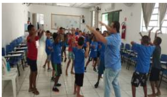
Fig 03- Acolhimento com música 14/03/24