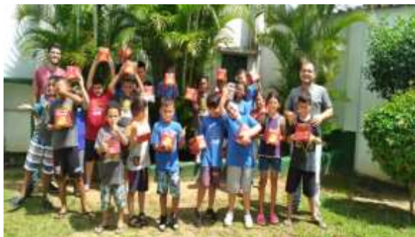
Fig 01- Entrega dos panetones 06/03/24