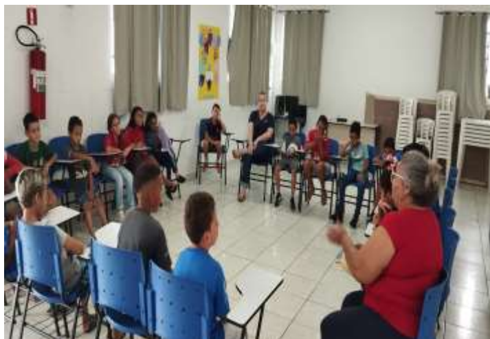
Roda de conversa/Bulling 27/03/24