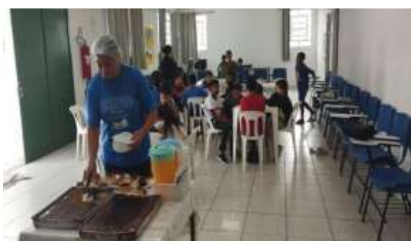
Fig 04- Lanche diário 26/03