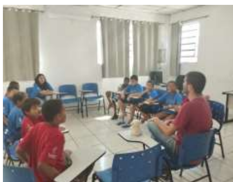
Roda de conversa 22/02/24