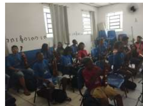
ENSAIO DA ORQUESTRA DE CORDAS 29/02/24