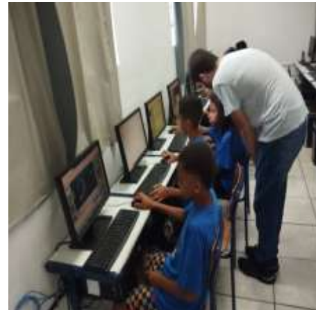
Jogos socioeducativos 15/02