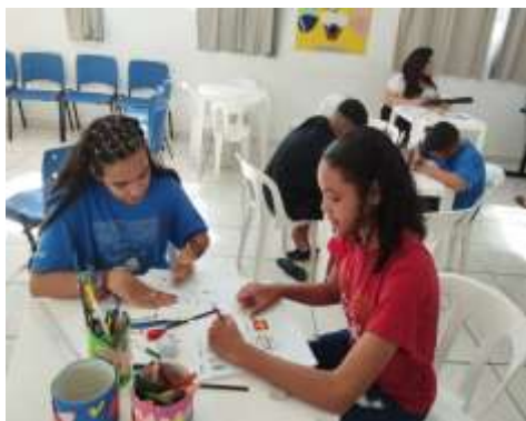
O que é arte?/desenhos 26/02