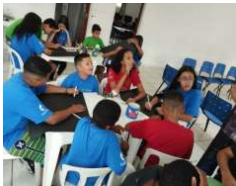
Cartaz temático 19/02