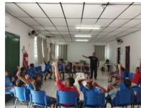
Dinâmica descubra o objeto 14/02/24