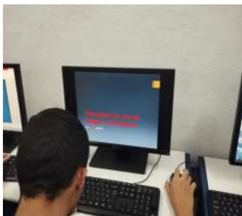
Campanha mensal/ fevereiro vermelho 22/02