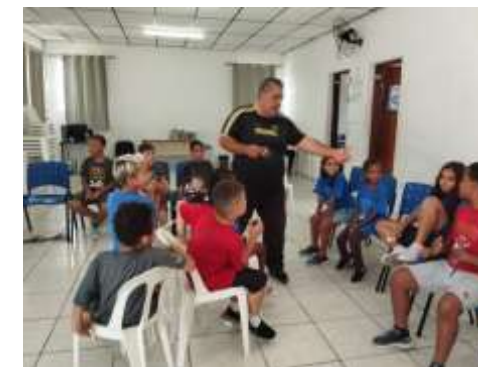
Dança da cadeira / 07/02/24