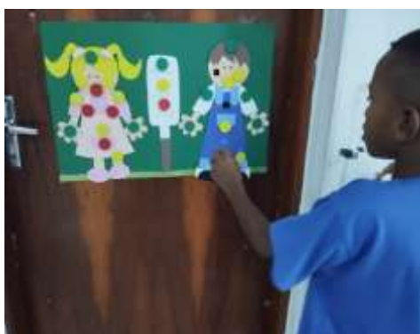
Semáforo do toque 20/02