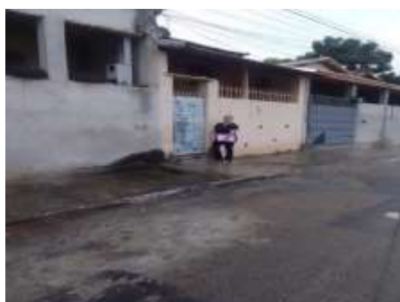
VISITA DOMICILIAR 15/02/24