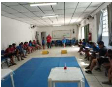
Dinâmica bate o sino 21/02/24