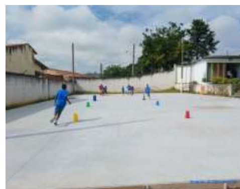
Esporte/corrida de cone 20/02/24