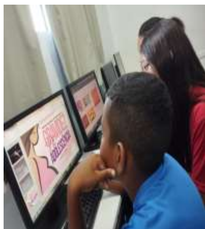
Prev. Da gravidez na adolescência 08/02