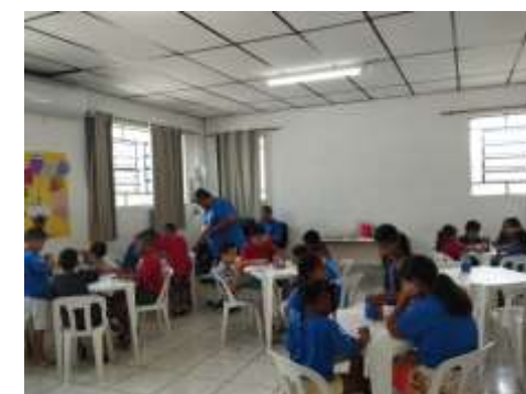
DINAMICA DO RACIOCÍNIO 28/02/24