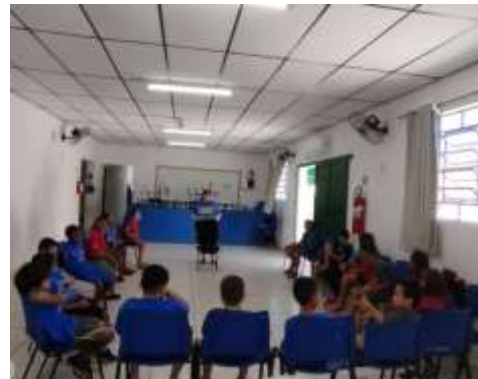
Maleta viajante 23/0