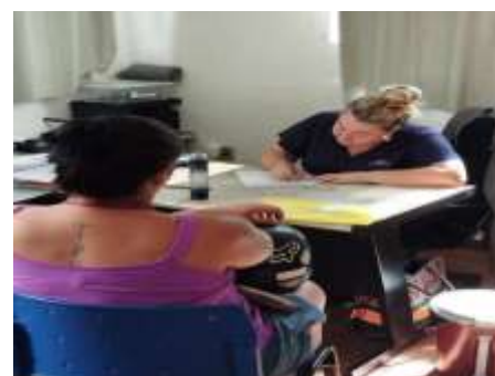
INSERÇÃO DE USUÁRIO 16/02/24