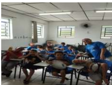
ATIV. PERCUSSÃO 21/02