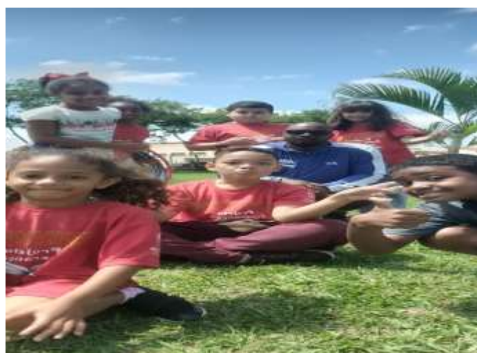
Ofic. Esportes/atletismo 19/12/23