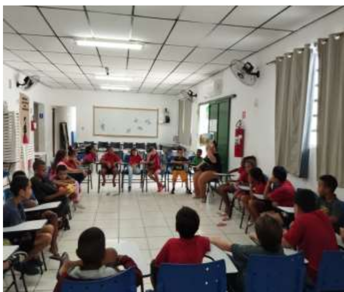
Ofic. Artes/história Patinho feio 08/12/23