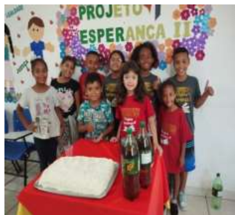
FIG 03 – aniversariante do mês