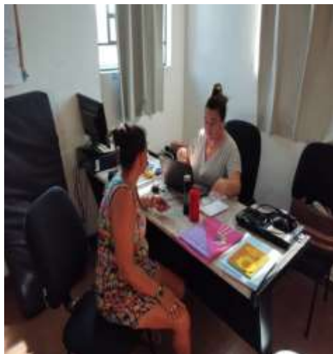
FIG 04- atendimento familiar 13/12/23