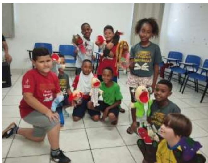
Ofic. Artes/ teatro com fantoches 15/12/23