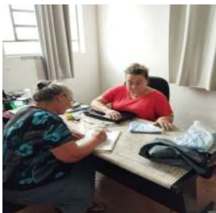
FIG 02 – entrega das camisetas – 04/12/23