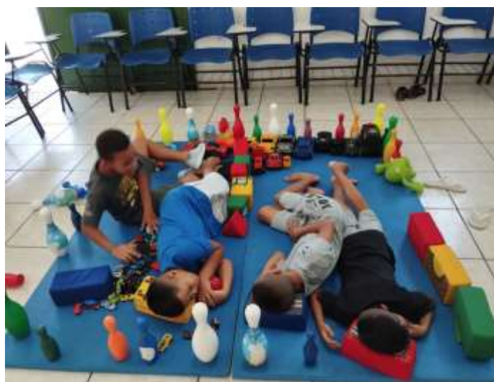
Ofic. Lazer e jogos – 06/12/23