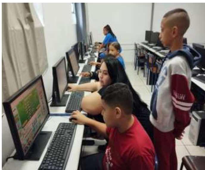
Ofic. Inf. /Campanha –Origem do Natal