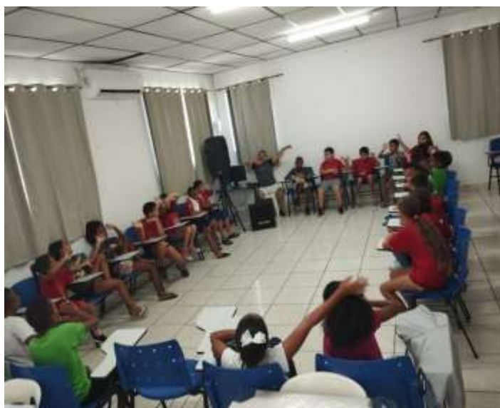
Ofic. Música Qual é a música