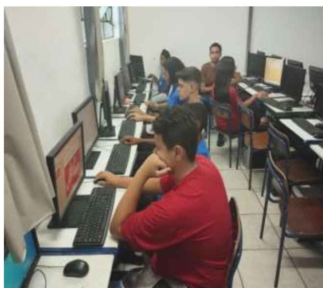
Ofic. Inf. /campanha Dez. Vermelho 12/12/23