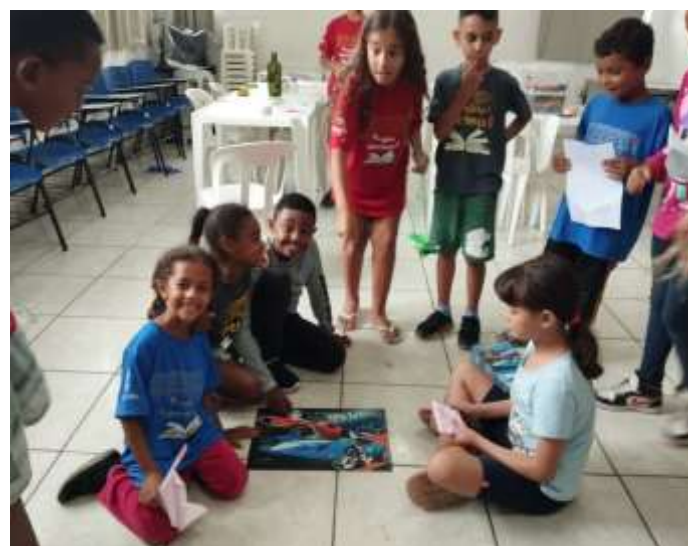
Ofic. Lazer e jogos / quebra-cabeça 06/12/23