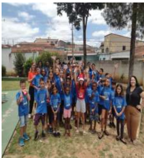
FIG 05 e 06 – Almoço de natal 13/12/23 (manhã e tarde)