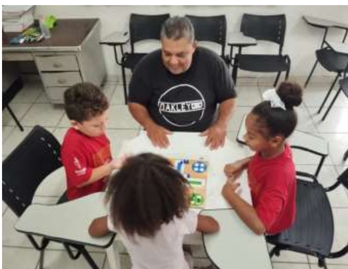
Ofic. Lazer e jogos /06/12/23