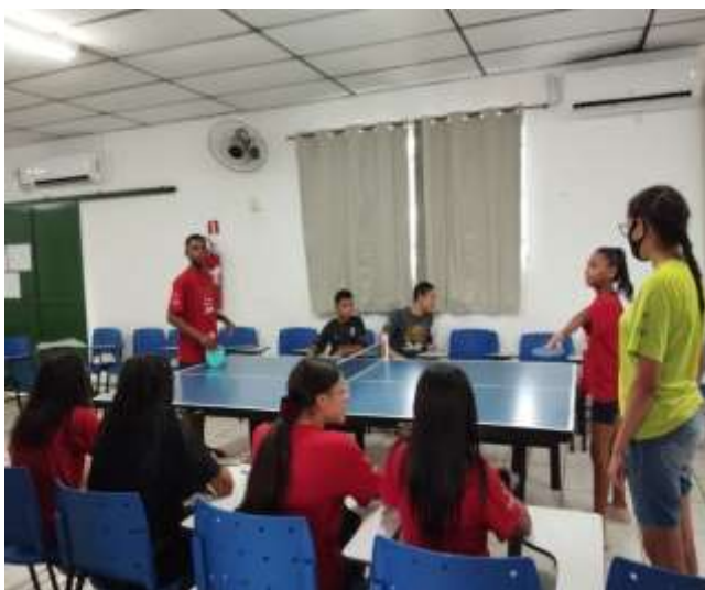
Ofic. Lazer e jogos /ping pong 19/12/23