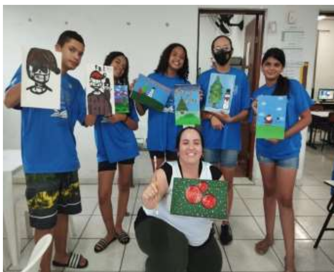
Ofic. Artes/pintura natalina