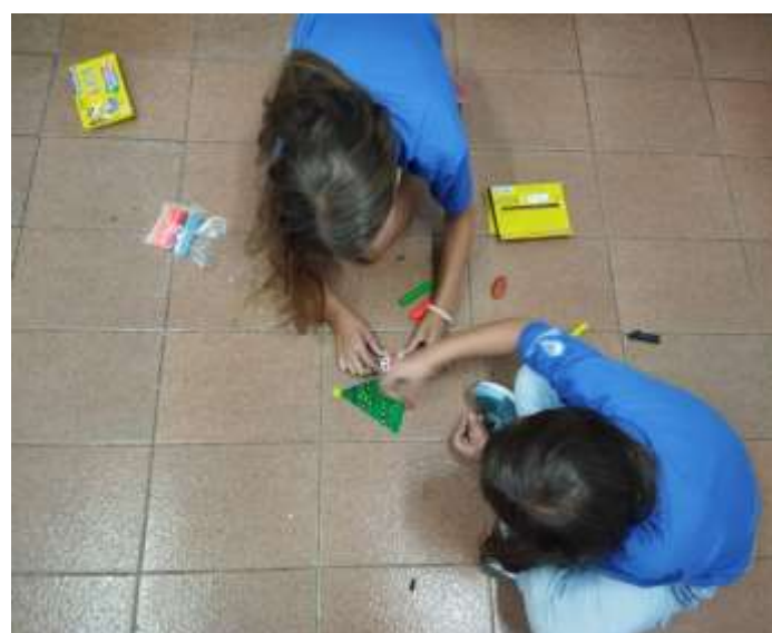
Ofic. De Artes/ massinha 14/12/23