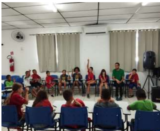
Regras de Convivência / roda de conversa 14/12/23

OBS: Oficina de Esporte, atividades executadas na Quadra de Esporte no bairro do Pedregulho (15 em 15 dias), em parceria com a Secretaria de Esportes de Guaratinguetá, que cedeu o profissional para a realização das atividades da oficina de esportes.