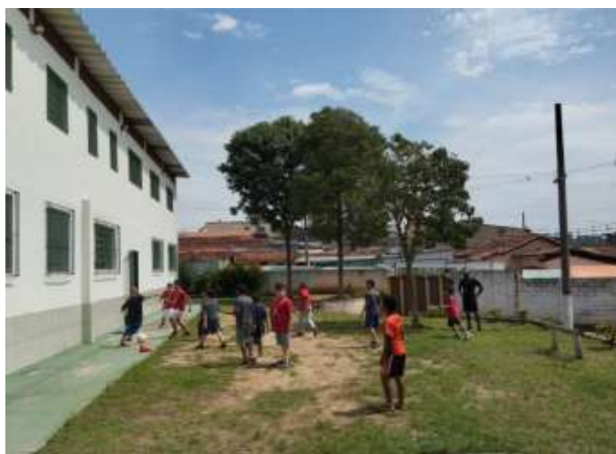
Ofic. Esportes/ futebol 05/12/23