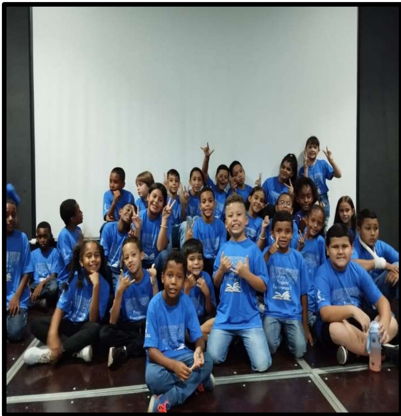
FOTO TIRADA NO SHOW DE TALENTOS 07/12/2023