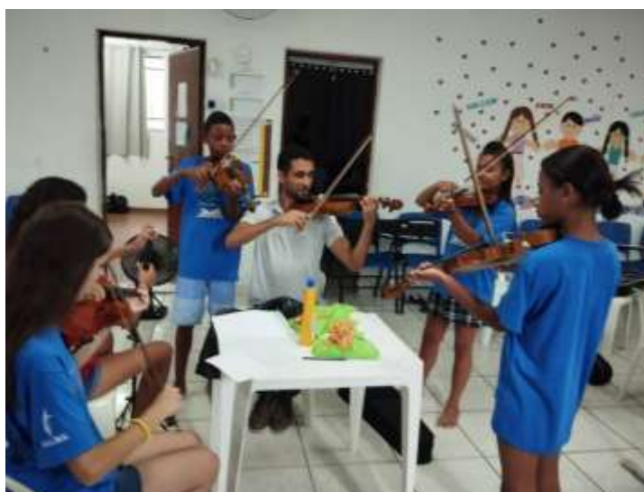
Ofic. Música / 19/12/23