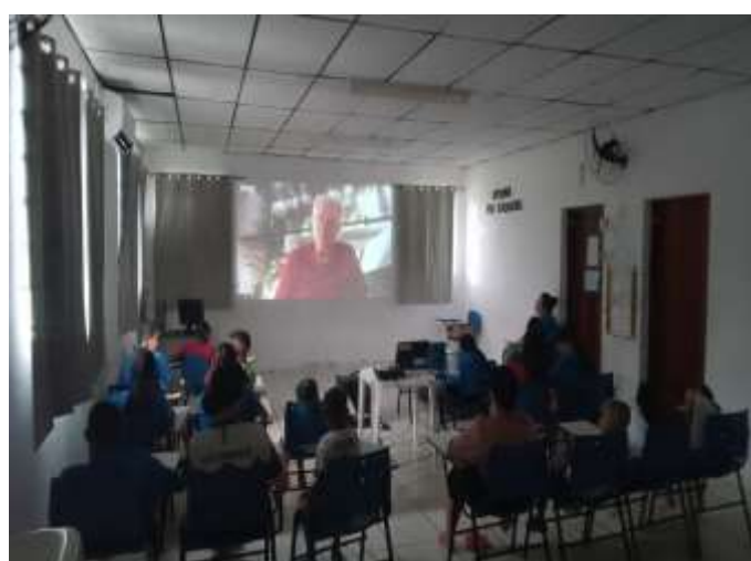
Ofic. Música / 14/12/23 - documentário