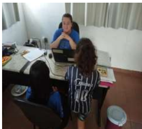
FIG 01 - mediação de conflito-05/12/23

Redução das ocorrências de situação de vulnerabilidade social e fortalecimento de vínculos familiares e comunitários.