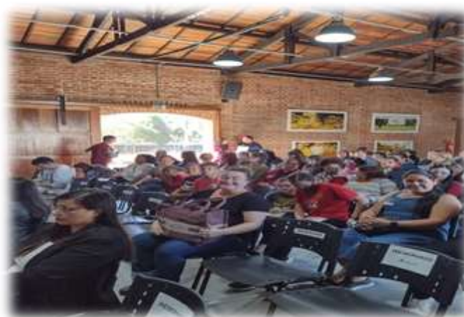
Conferencia da Assistência Social