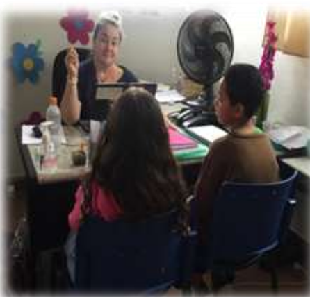
Mediação Conflito 23/07