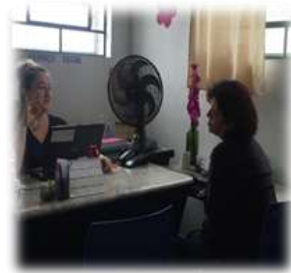
Atend. Qualificado/familiar 26/07