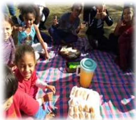
Lanches diários 05/07 e 20/07

Redução das ocorrências de situação de vulnerabilidade social e fortalecimento de vínculos familiares e comunitários.