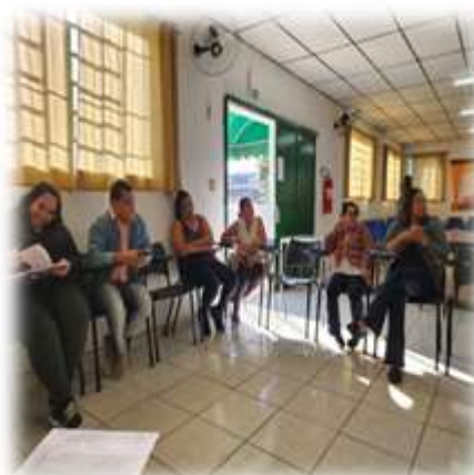
Reunião Equipe Técnica 31/07