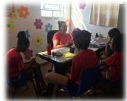
Mediação de conflito entre usuárias 24/04/23