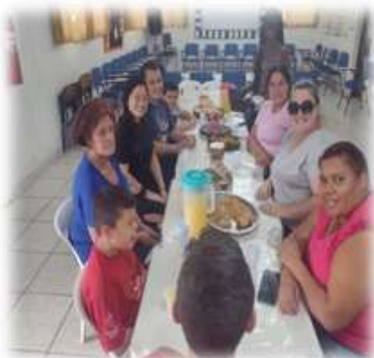
Reunião socioeducativa: adolescentes e familiares 20/4/23