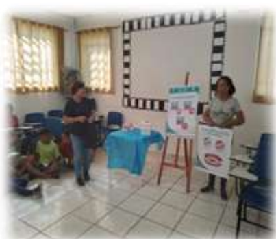
Palestra Higiene Bucal 19/04/23