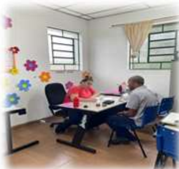
Inserção de usuário 13/04/2023