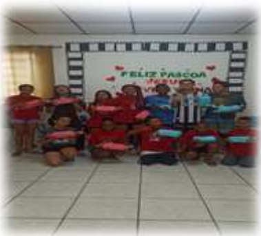
Entrega lembrança Páscoa