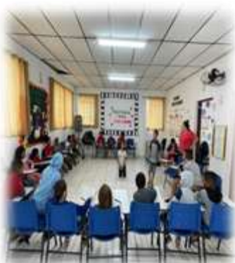
Dinâmica da mímica 05/04/23