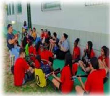
Acolhimento com música 18/04/23