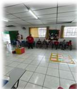
Dinâmica do cubo 27/04/23