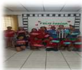
Lembrança de Páscoa