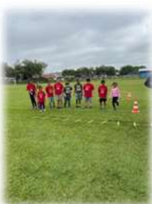
Escala funcional 11/04/23