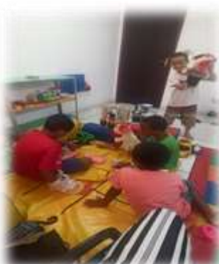
Brincadeira livre 06/04/23