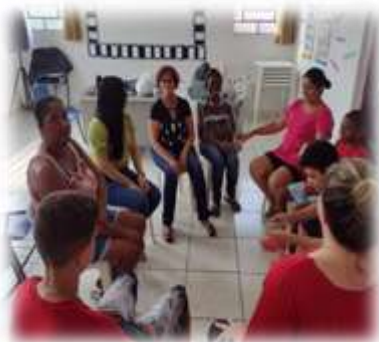
Trabalhando o fortalecimento de vínculo familiar