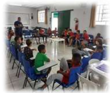
Trabalhando regras de convivência 12/04/23