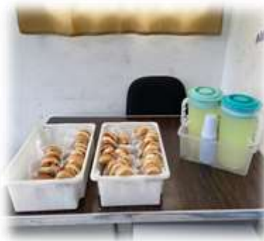
Lanche diário 19/04/23