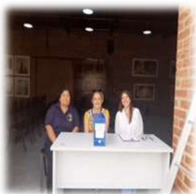
Pleito Eleitoral 13/04/23