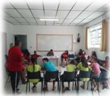
Acolhimento diário 03/04/23

Redução das ocorrências de situação de vulnerabilidade social e fortalecimento de vínculos familiares e comunitários.