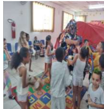
Dançando com a criança 11/10/22