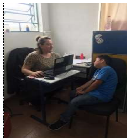
Atend. Individual usuário