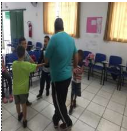
Brincando roda 05/10/22