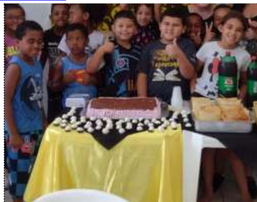
Aniversariantes do mês