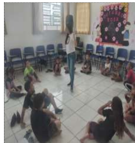
Regras de convivência 27/10/22