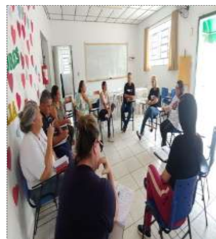
Reunião equipe técnica 11/10/22