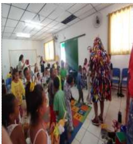
Semana da criança 14/10/22