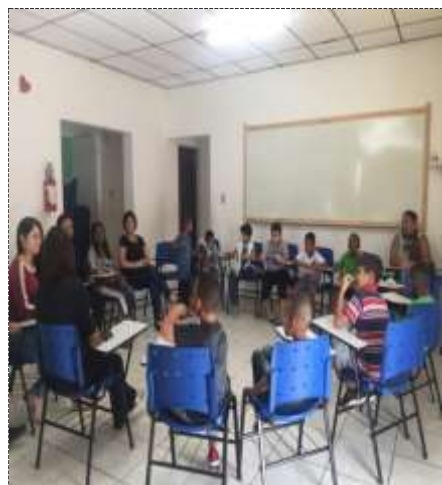
Debate Outubro Rosa /10/10/22