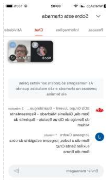
08/10/22 Reunião CMDCA