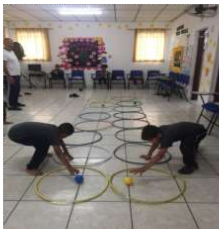
Circuito com bolas /03/10/22