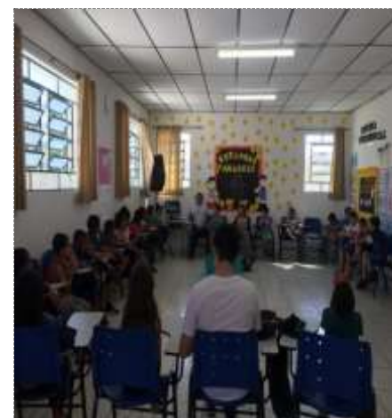
Acolhimento diário 27/10/22