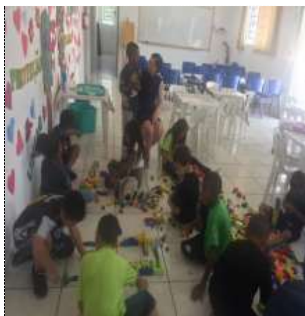
Bolas coloridas 20/10/22