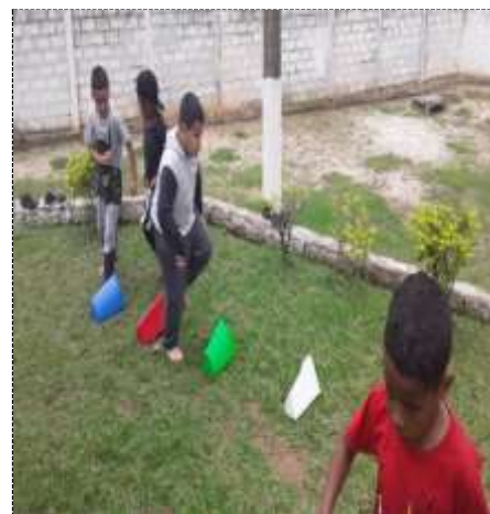
Circuito com cones/17/10/22