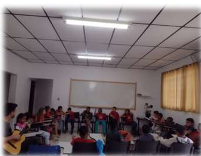
Acolhimento diário/regras de convivência