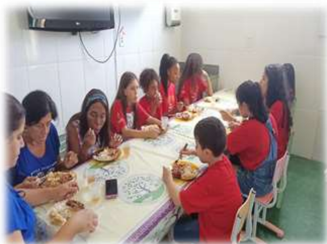
Almoço de Natal 15/12/22