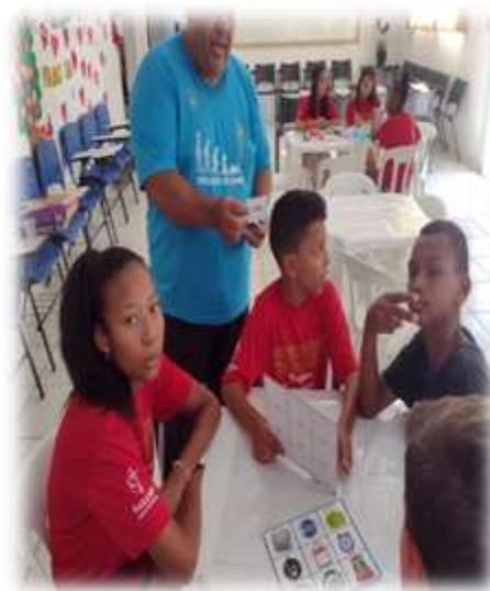
Oficina de esportes