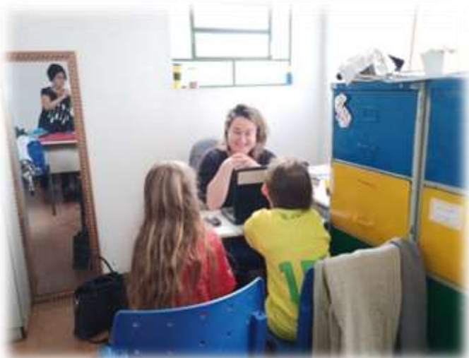
Atendimento usuários 05/12/22