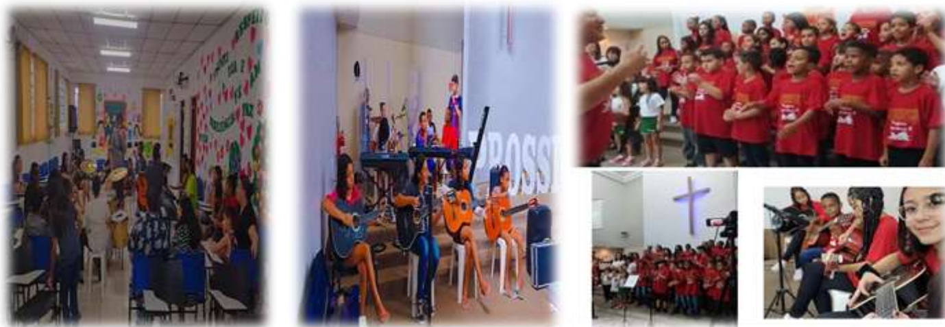
Oficina de Artes