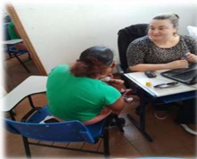
Atendimento familiar 09/12/22