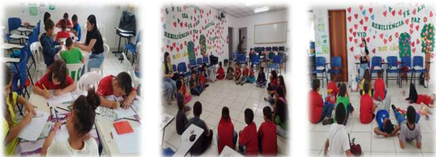
Oficina de lazer e jogos