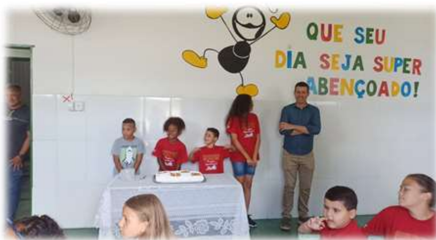
Aniversariante do mês